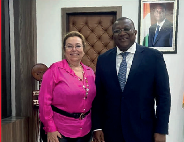
Accord de parrainage de Monsieur Amadou COULIBALY, Ministre de la Communication, porte parole du Gouvernement.