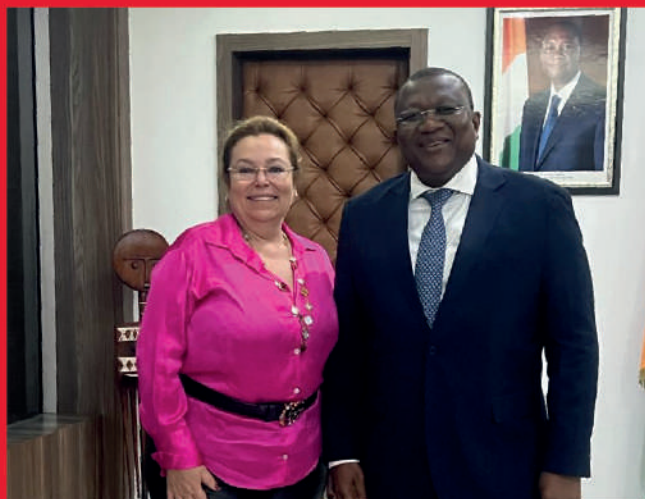
Accord de parrainage de Monsieur Amadou COULIBALY, Ministre de la Communication, porte parole du Gouvernement. - Édition juillet 2024