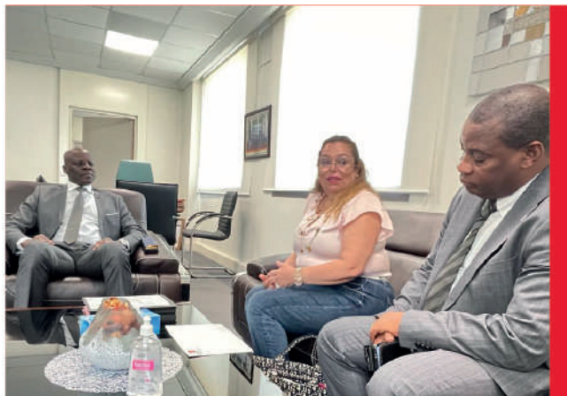
Séance de travail avec le Ministre de l'Enseignement Supérieur et de la Recherche Scientifique, Professeur Adama DIAWARA qui accepte la Présidence du Grand Salon MYCAMPUS FAIR à Abidjan. - Édition juillet 2024

Par la diversité des offres de formation, le salon est aujourd'hui le rendez-vous incontournable des lycéens et étudiants en Côte d'Ivoire.